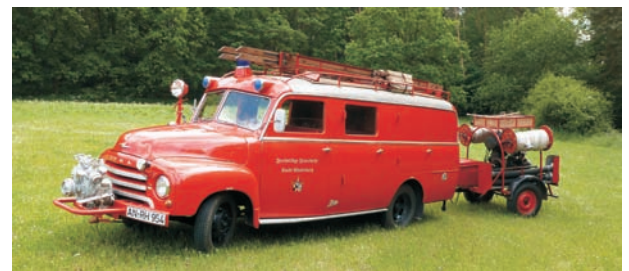
Dieses Oldtimer kann die Feuerwehr Windsbach selbst zum Treffen am Jubiläumswochenende beisteuern.

Den feierlichen Auftakt des Festwochenendes begeht die Feuerwehr Windsbach am Freitag, den 13. Juli bei einem Festkommers mit geladenen Gästen der umliegenden Feuerwehren, den Feuerwehrführungs Kräften aus dem Landkreis und Gästen aus der Politik. Besonders freut es die Windsbacher, dass auch einige Kameraden ihrer Patenwehr aus Wahrenholz (Niedersachsen) teilnehmen. In diesem festlichen Rahmen werden auch durch den stv. Landrat Herrn Kurt Unger die staatlichen Ehrungen für die langjährigen aktiven Feuerwehrdienst vorgenommen.