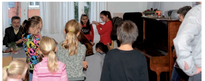
Team Tea Together und Team Sprachcafé