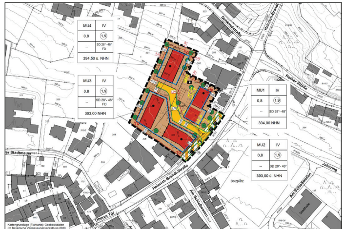
Auszug aus dem Planblatt des Bebauungsplans „Baugebiet Nr. 29 „An den Feldwiesen“

Mit der Aufstellung des Bebauungsplans sollen die bauplanungsrechtlichen Voraussetzungen zur städtebaulich geordneten Entwicklung von zusätzlichen Wohnbauflächen, Flächen für Dienstleistungsangebote und soziale Zwecke in innerstädtischer Lage geschaffen werden.