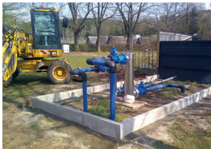
UV Desinfektion bekommt eine Einhausung